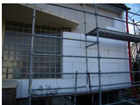
Isolation par l'extérieur - Janvier 2014