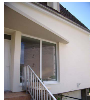
Remplacement mur de verre Janvier 2014