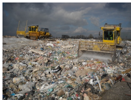
Alvéole en exploitation