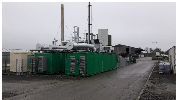
Valorisation du biogaz

L'Observatoire est également sollicité par les "acteurs du déchet" pour répondre à des questions techniques, économiques ou réglementaires, participer à des réunions d'informations, fournir des données à des collectivités réalisant des outils de planification ou encore mettre en relation les différents acteurs du déchet.