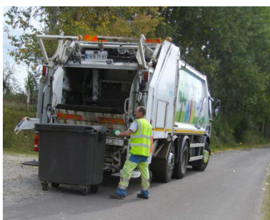
La production individuelle de déchets ménagers en Normandie (Année 2015)